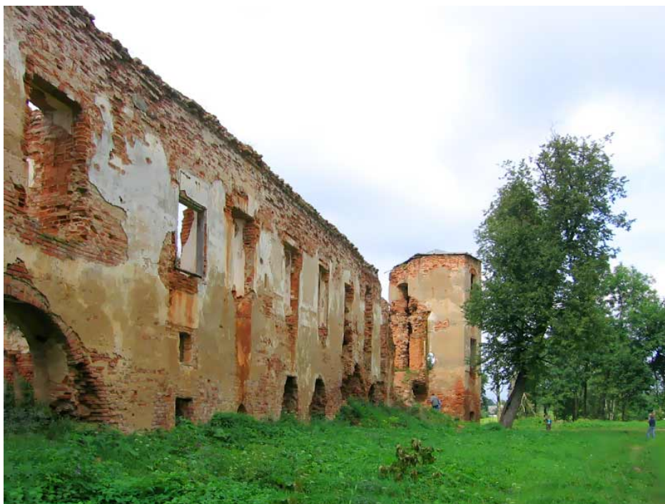
Alšėnų pilies griuvėsiai

Dabar išlikę dviejų gyvenamųjų sparnų (šiaurės vakarinio ir šiaurės rytinio, kuriame buvo įvažiavimo vartai) ir prie jų prišlietų dviejų kampinių bokštų griuvėsiai, dalis žemės pylimų, parko likučiai su senomis liepomis. Piliavietė itin daug lankoma turistų, pastaruoju metu aptvarkytos pilies prieigos.