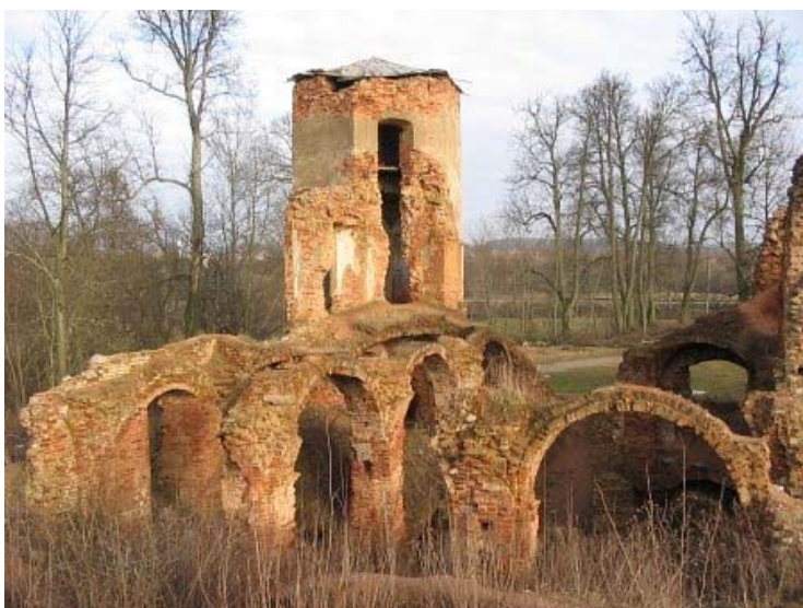
Alšėnų pilies griuvėsiai (Глобус Беларусі)