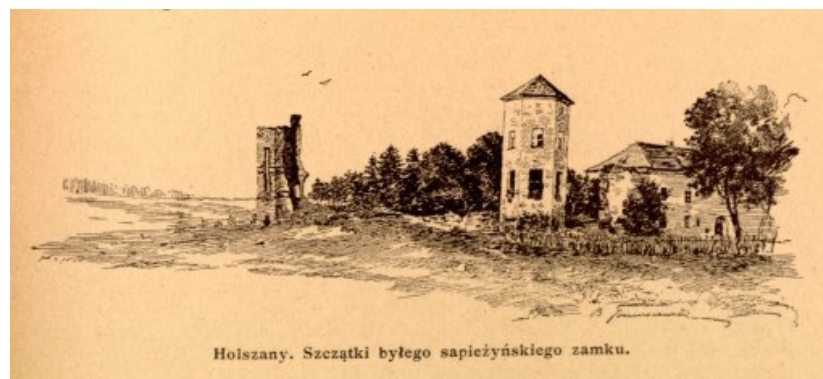
Alšėnų pils XIX a. pab.