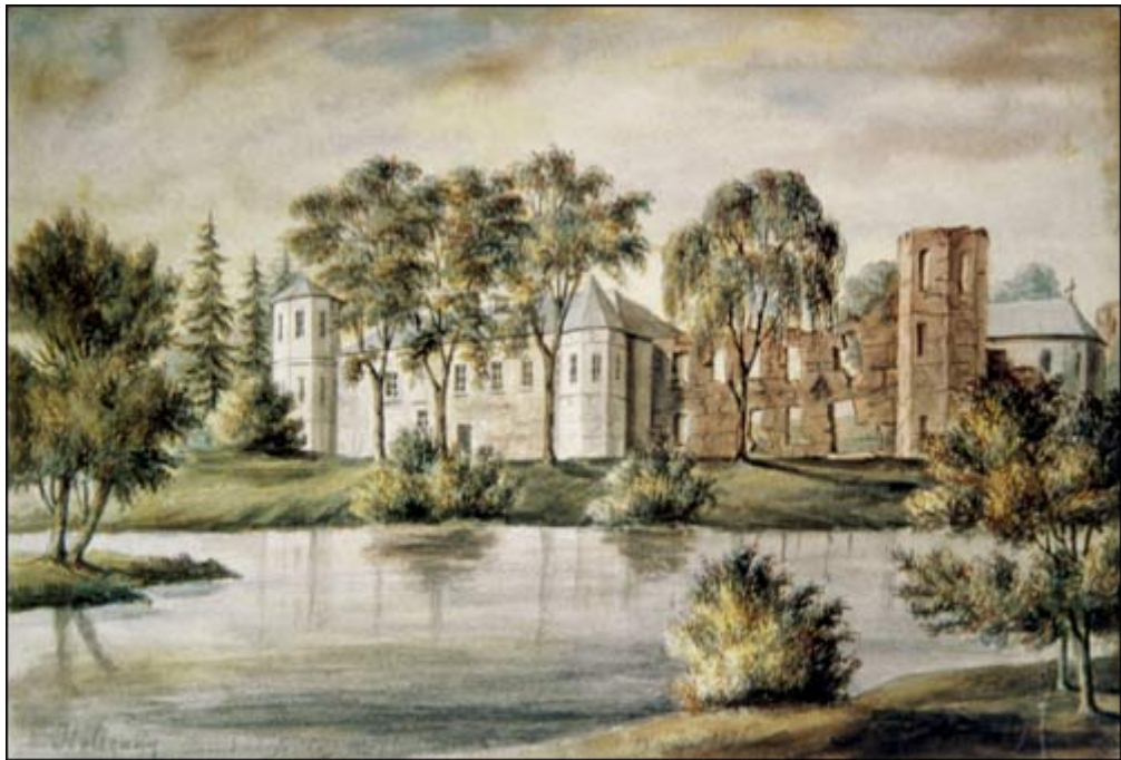
Alšėnų pils. Napaleonas Orda, 1876

kadise kiemus supusių renesansinių galerijų, turtingo vidaus ir išorės dekoro (stiuko lipdinių, krosnių iš koklių dekoruotų Sapiegų herbais ir kt.) neliko nė ženklo.