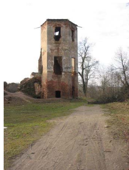
Šiaurinio bokšto griuvėsiai