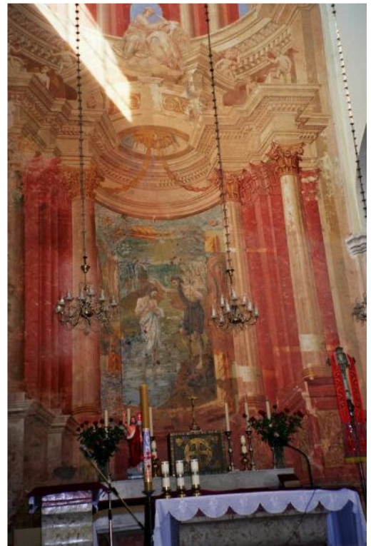
Šv. Jono Krikštytojo bažnyčios pagrindinė nava ir centrinis altorius su freska