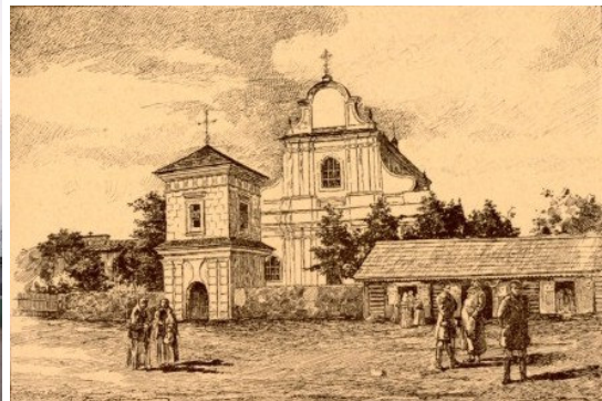
Alšėnų Šv. Jono Krikštytojo bažnyčia šiandien ir XIX a. pabaigoje

Bažnyčioje išlikęs vertingas XVIII a. vidurio interjeras, ypač iliuzine tapyba atliktas centrinis altorius (apie 1790 m., vaizduojama scena – Jonas Krikštytojas krikštija Jėzų; altorius-freska restauruota 2006-2007 m. lenkų restauratorių). Sapiegų laidojimo koplyčia. Bažnyčioje specialiai įrengtoje koplyčioje buvo palaidotas fundatorius Povilas Steponas Sapiega ir tris jo žmonos. Iš šaltinių žinoma, kad antkapis kompozicija priminė Leono Sapiegos ir dviejų jo žmonių antkapį Vilniaus Šv. Mykolo Arkangelo bažnyčioje. XVIII a. bažnyčią rekonstruojant šis vertingas antkapinės renesanso skulptūros paminklas buvo išardytas, išliko tik epitafinės lentos su figūromis. Iki šiol bažnyčios šoninėje (dešiniojoje) navoje išlikusi XVIII a. freska – tapyta epitafija su kunigaikščių Sapiegų herbu, o antkapinės skulptūros išgabentos į BR Mokslų akademijos Baltarusijos senosios kultūros muziejų Minske.