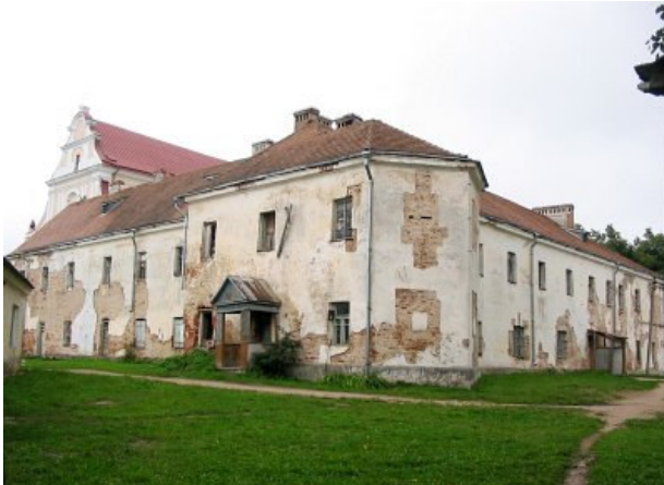
Alšėnų Pranciškonų vienuolyno pastatai

Prie bažnyčios veikęs pranciškonų vienuolynas uždarytas 1832 m., dalis pastatų sugriauta, o likusiuose įkurtos kareivinės. Po II Pasaulinio karo čia buvo sandėlis, vaikų namai ir mokykla-internatas. Architektūrinis ansamblis kaip tik tuomet labiausiai ir nukentėjo. Dabar dalis vienuolyno pastatų grąžinta pranciškonams, likusioje dalyje veikia Valstybinio Baltarusijos meno muziejaus filialas.