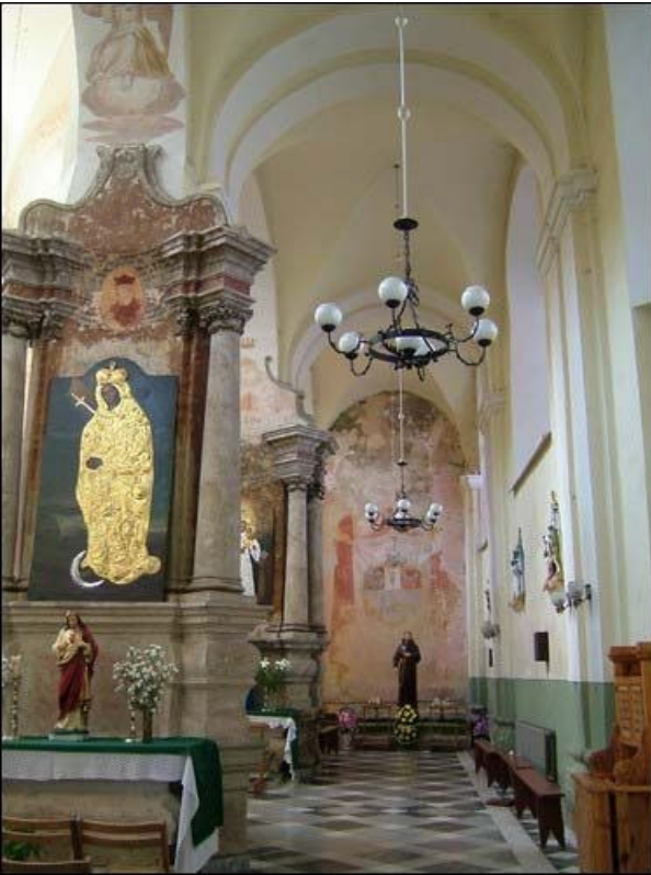
Šv. Jono Krikštytojo bažnyčios šoninė (dešinė) nava. Tolumoje XVIII a. freska su kunigaikščių Sapiegų herbu, kur buvo ir Povilo Stepono Sapiegos šeimos antkapis.