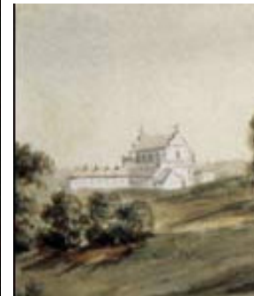
Alšėnų pilis. Napoleonas Orda, 1876 (Tolumoje matyti pranciškonų vienuolyno ir Šv. Jono Krikštytojo bažnyčios ansamblis)