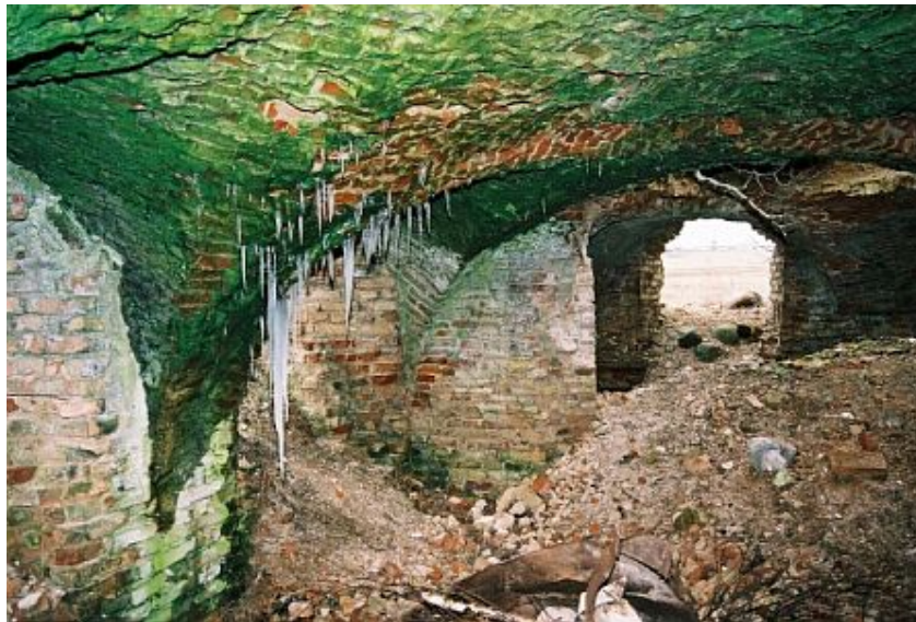
Нуotraukos іў Глобус Беларусі