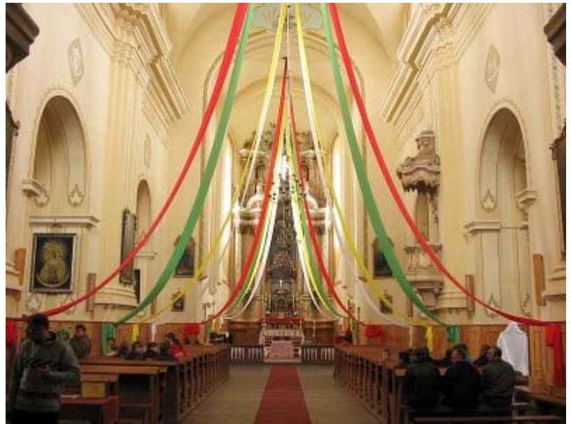
Pagrindinė nava, dešinėje matyti ambona

Barūnai labiausiai žinomi dėl stebuklingo Barūnų Dievo Motinos paveikslo. Barūnų Dievo Motinos kultui daugiau nei 300 metų (jubiliejus buvo atšvęstas 1991 m. rugpjūčio mėnesį). XIX a. pradžioje paveikslas buvo vienas iš labiausiai garbinamų Vilniaus apylinkėse, o dabar - vienas labiausiai garbinamų Baltarusijoje. Rugpjūčio 29 dieną vyksta garsūs Barūnų Dievo Motinos atlidai. Kadaise šie atlidai buvo garsūs visame Vilniaus krašte ir sutraukdavo tikinčiuosius iš tolimų vietovių, taip pat ir iš dabartinės Lietuvos teritorijos.