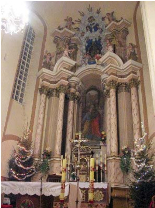
Centrinis altorius (Глобус Беларусі)