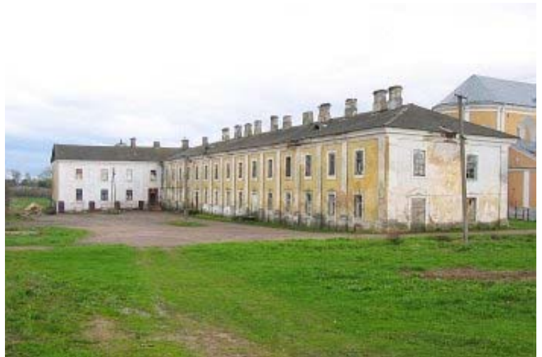
Vienuolyno vartai ir pastatai

Cerkvė - bazilikinis trinavis su pusapvale apside pastatas. Fasadas išsiskiria kompozicijos originalumu - du trijų tarpsnių kvadratinio plano bokštai pasukti kampu į pagrindinį fasadą. Cerkvė priskirtina Vilniaus baroko architektūros mokyklai. Interjere gerai išlikęs Vilniaus baroko architektūros mokyklai būdingas centrinis altorius, ambona, vargonų choras.