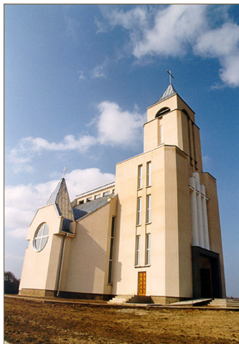
Senosios Kryžių koplyčios ant Dusios ežero kranto vieta ir naujoji koplyčia ( http://vilkaviskis.lcn.lt/ )