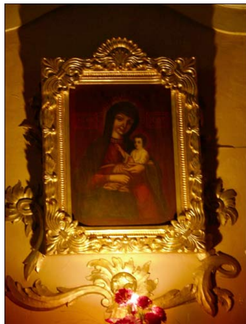
Barūnų Dievo Motinos altorius ir paveikslas (Radzima.org)