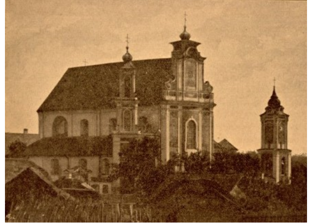
Šv. Petro ir Povilo bažnyčia šiandien ir XIX a. pabaigoje