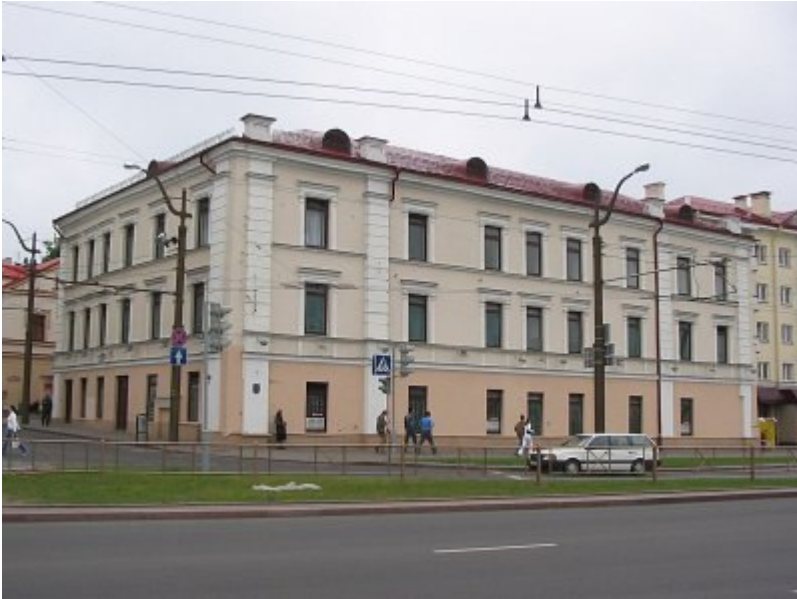
Stepono Batoro miesto rūmai (namas) šiandien

Stepono Batoro miesto rūmai (namas) – Batorievka (XVI a. II p., XIX a.). Steponas Batoras, be pilių teritorijoje buvusių rezidencinių rūmų, pasistatydino rūmus ir mieste. Pagal italo architekto Scotto iš Parmos projektą renesansiniai rūmai XVI a. II pusėje buvo pastatyti prie centrinės miesto aikštės. Rūmai kelis kartus stipriai perstatyti. 1885 m. pastatas stipriai nukentėjo nuo gaisro. Po pastarojo perstatymo pastatas neteko pirminės išvaizdos.