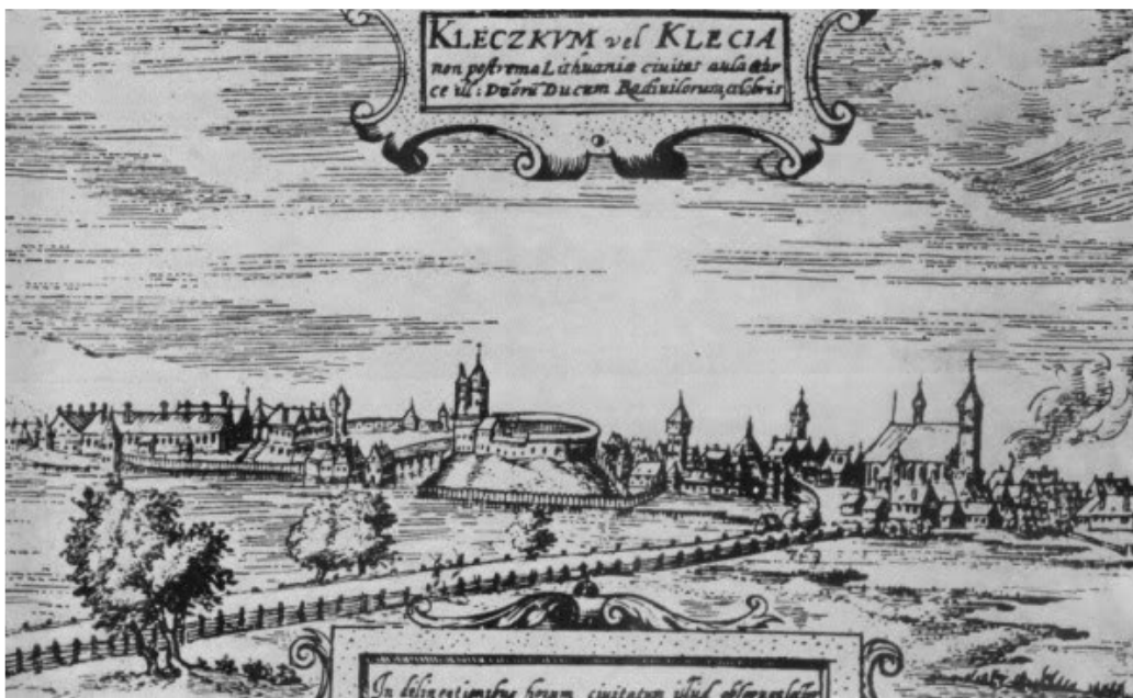
Klecko panorama. Tomo Makovskio graviūra, 1604 m.

1558 m. Kleckas atitenko kunigaikščiams Radviloms - Klecką ir Klecko kunigaikštiją Lietuvos didysis kunigaikštis Žygimantas Augustas padovanojo Radvilai Juodajam. 1586 m. Radvilos greta Nesvyžiaus ir Olykos ordinacijų (majoratų) sudarė ir Klecko ordinaciją. 1586-1939 m. Kleckas buvo Klecko ordinacijos centras. 1874 m. Klecko ir Nesvyžiaus Radvilų ordinacijos buvo sujungtos, kadangi tiesioginių Nesvyžiaus ordinacijos Radvilų linijos palikuonių nebeliko (linija nutrūko 1813 m. mirus Dominykui Radvilai). Radviloms Kleckas, kaip ir Nesvyžius, priklausė apie 400 metų. XVII a. pr. Kleckas buvo gana didelis miestas su pilių kompleksu, miesto gynybine sistema ir keliais mūriniais bei mediniais sakraliniais pastatais (žr. Tomo Makovskio graviūrą). Klecko miesto panorama (graviūra) buvo sukurta Nesvyžiaus kunigaikščių Radvilų užsakymu. Tomas Makovskis XVII a. pr. sukūrė seriją graviūrų, kuriose buvo užfiksuoti svarbiausi kunigaikščių valdomi miestai.