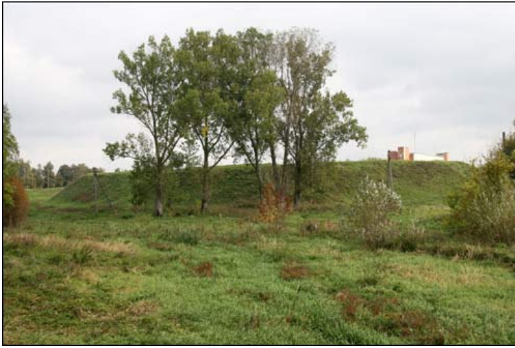
Piliakalnis. Už jo matosi ligoninės pastatai.

Klecko piliakalnis (XI-XVII a.) – archeologijos, fortifikacinės architektūros paminklas. Pirmieji įtvirtinimai šiame piliakalnyje pastatyti dar XI amžiuje. XVI-XVII a. (Radvilų laikais) pilį sudarė dvi dalys – Aukštutinė pilis (apvalaus plano piliakalnyje) ir Žemutinė pilis – įtvirtintas aplink pilį plytėjęs miestas (žr. T. Makovskio graviūrą). Aukštutinė pilis buvo išsidėsčiusi ant piliakalnio upių Lan ir Silnaja santakoje. Šiandien gerai išlikęs Aukštutinės pilies piliakalnis, žemės įtvirtinimų fragmentai. Piliakalnis yra beveik apvalaus plano (aikštelė apie 90 x 100 m). Pirmoji medinė pilis ir žemės įtvirtinimai greičiausiai čia įrengti XI a. Kijevo Rusios kunigaikščio Jaroslavo Išmintingojo. Pilis kelis kartus buvo sudeginta, sunaikinta 1503 m. totorių antpuolio metu, atstatyta. Pilies pastatais privalėjo rūpintis vietiniai didikai ir miestiečiai. XVII a. rašytiniuose šaltiniuose minimas Žemutinės pilies teritorijoje įtvirtintas medinis Radvilų dvaras, Žemutinės pilies teritorija aptverta medinėmis sienomis su dešimčia bokštų ir dvejais vartais. Įtvirtintas Radvilų dvaras–pilis nukentėjo XVII a. vid. ir Šiaurės karų metu, o XVIII a. pab. jau pradėta ardyti. Pilis ir įtvirtinimai užfiksuoti Tomo Makovskio XVII a. pr. Klecko miesto panoramoje. Šiandien piliavietė nežymima jokiais atminimo ženklais, sunkiai surandama. Piliakalnis yra šalia miesto ligoninės.