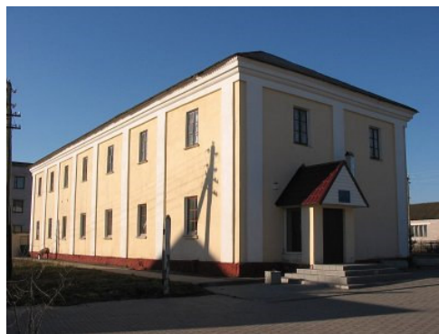
Vienuolyno gyvenamasis korpusas.