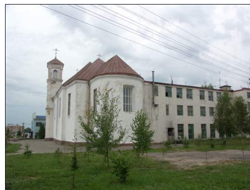
Bažnyčia su prie jos XX a. 8 deš. pristatytu internato pastatu.