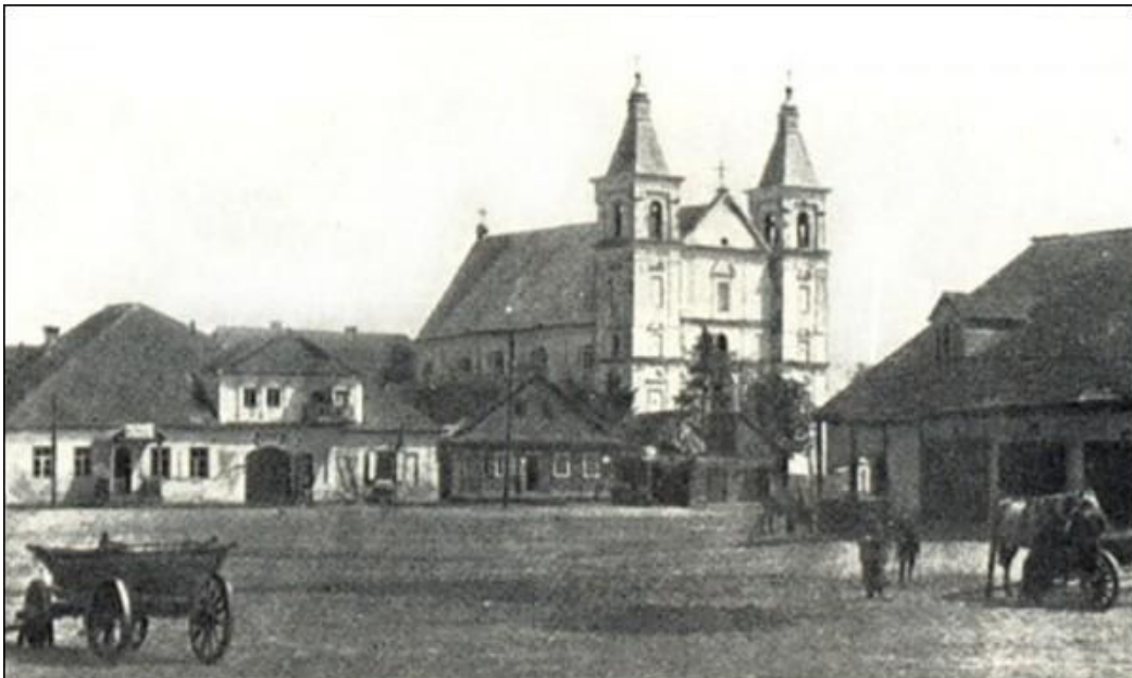
Klecko centrinė aikštė, buvusios Dominikonų bažnyčios fasadas, 1929 m.

Klecko piliakalnis (XI-XVII a.) – archeologijos, fortifikacinės architektūros paminklas. Pirmieji įtvirtinimai šiame piliakalnyje pastatyti dar XI amžiuje. XVI-XVII a. (Radvilų laikais) pilį sudarė dvi dalys – Aukštutinė pilis (apvalaus plano piliakalnyje) ir Žemutinė pilis – įtvirtintas aplink pilį plytėjęs miestas (žr. T. Makovskio graviūrą). Aukštutinė pilis buvo išsidėsčiusi ant piliakalnio upių Lan ir Silnaja santakoje. Šiandien gerai išlikęs Aukštutinės pilies piliakalnis, žemės įtvirtinimų fragmentai. Piliakalnis yra beveik apvalaus plano (aikštelė apie 90 x 100 m). Pirmoji medinė pilis ir žemės įtvirtinimai greičiausiai čia įrengti XI a. Kijevo Rusios kunigaikščio Jaroslavo Išmintingojo. Pilis kelis kartus buvo sudeginta, sunaikinta 1503 m. totorių antpuolio metu, atstatyta. Pilies pastatais privalėjo rūpintis vietiniai didikai ir miestiečiai. XVII a. rašytiniuose šaltiniuose minimas Žemutinės pilies teritorijoje įtvirtintas medinis Radvilų dvaras, Žemutinės pilies teritorija aptverta medinėmis sienomis su dešimčia bokštų ir dvejais vartais. Įtvirtintas Radvilų dvaras–pilis nukentėjo XVII a. vid. ir Šiaurės karų metu, o XVIII a. pab. jau pradėta ardyti. Pilis ir įtvirtinimai užfiksuoti Tomo Makovskio XVII a. pr. Klecko miesto panoramoje. Šiandien piliavietė nežymima jokiais atminimo ženklais, sunkiai surandama. Piliakalnis yra šalia miesto ligoninės.