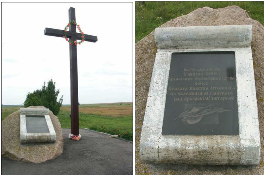
Paminklinė lenta.