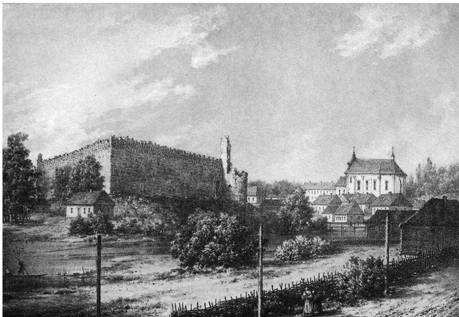
Lydos pilis XIX a. II pusėje. N. Ordos piešinys, 1873-1883