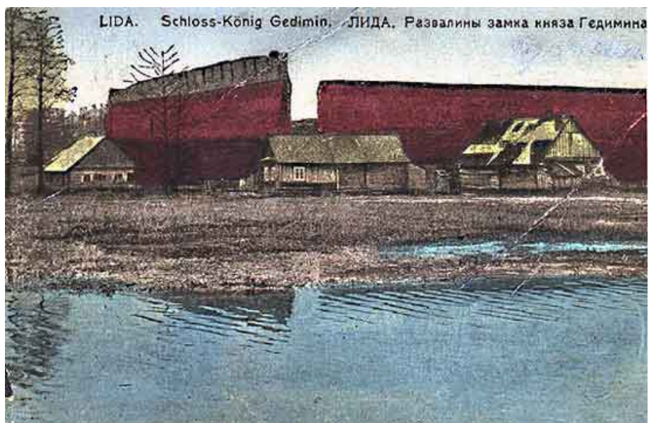
Lydos pilis XX a. pradžioje