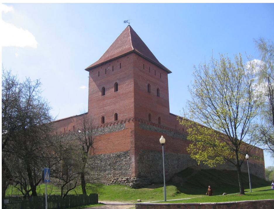
Lydos pilis šiandien