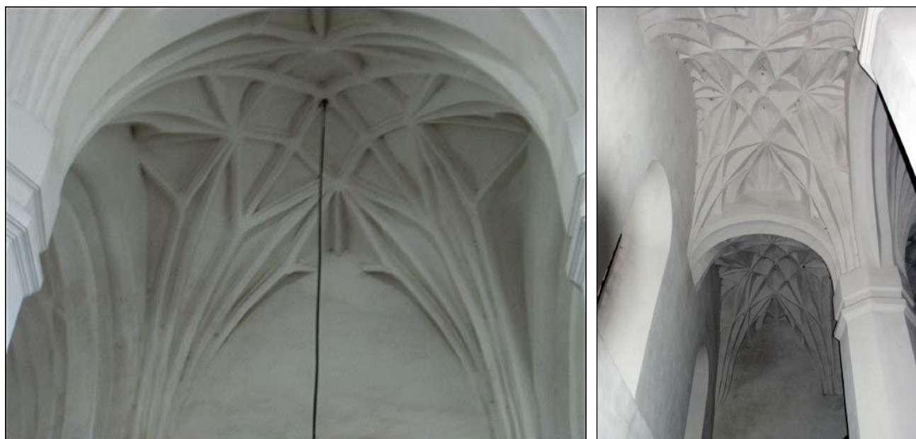
Murovankos cerkvės skliautai