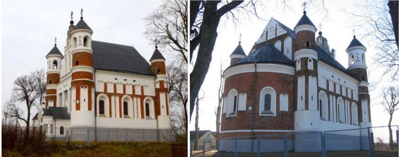
Murovankos Skaisčiausios Dievo Motinos Gimimo cerkvė (Глобус Беларусі)

Murovankos Skaisčiausios Dievo Motinos Gimimo cerkvė (XVI a. pr. - tarp 1516–1542). Cerkvė - unikalus, vienas vertingiausių sakralinės gotikos paminklų LDK ir dabartinėje Baltarusijoje. Cerkvė priskirtina unikaliam tik LDK būdingam reiškiniui - gotikinių cerkvių statybai. Cerkvė skirtingoje literatūroje įvardijama dvejopai – Murovankos arba Malomožeikovo (3 km nuo Malomožeikovo kaimo).