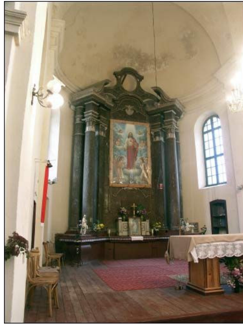
Šv. Mikalojaus parapiinė bažnyčiosfasadas ir pagrindinis altorius