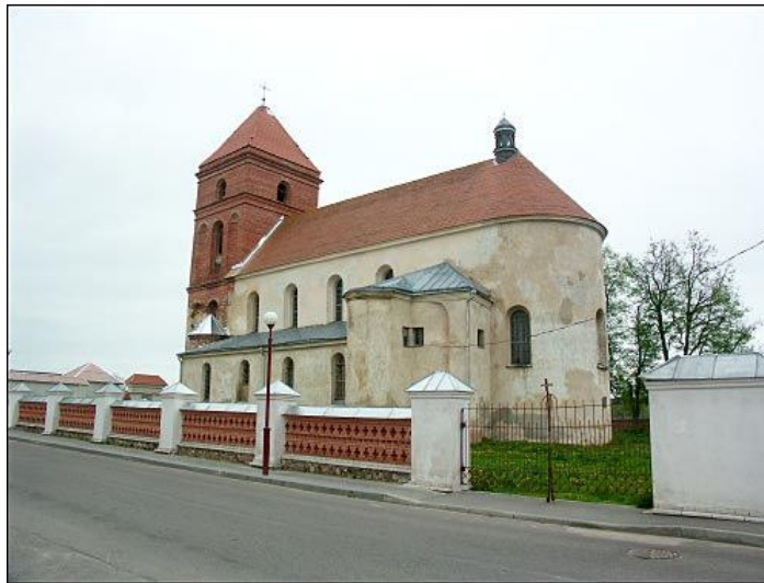
Myro Šv. Mikalojaus parapiinė bažnyčia

Myro Šv. Mikalojaus parapiinė bažnyčia (1599-1605). 1587 m. Mikalojus Kristupas Radvila Našlaitėlis fundavo pirmąją medinę parapiinę bažnyčią. Bažnyčią konsekrovo Radvilos Našlaitėlio brolis Vilniaus vyskupas Jurgis Radvila. Bažnyčiai pasirinktas Mikalojaus Kristupo Radvilos Našlaitėlio dangiškojo globėjo vardas - Šv. Mikalojaus titulas, tuo tarpu Myro pilies koplyčia pašventinta Šv. Kristupo vardu. 1599 m. medinė bažnyčia nugriauta, o jos vietoje 1599-1604 m. pastatyta nauja mūrinė, konsekruota 1605 metais. Bokšte įmūryta bažnyčios statybos datą nurodanti raudono marmuro atminimo lenta. Taip pat prie bažnyčios Radvila Našlaitėlis fundavo Šv. Škaplieriaus brolijos špitolę ir mokyklą vaikams (1610). Špitolė buvo sugriauta XVII a. vid. karų metu. Visi pastatai stipriai nukentėjo Šiaurės karo metu. 1710 m. Radvila Žuvelė atnaujino bažnyčią, kleboniją ir kitus pastatus.