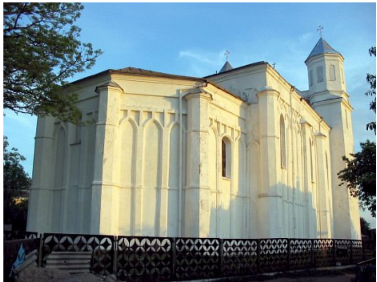
Naugarduko Šv. Boriso ir Glebo cerkvė šiandien