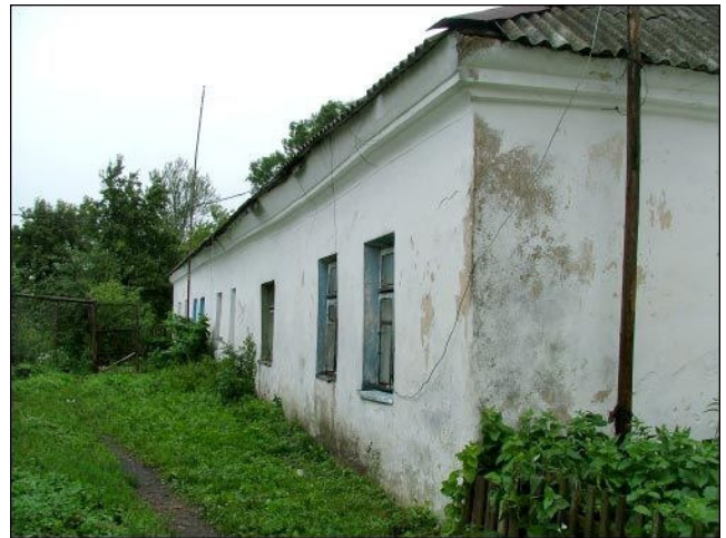
Išlikęs bazilijonų vienuolyno korpusas