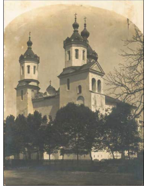
Naugarduko Šv. Boriso ir Glebo cerkvė XIX a. II pusėje N.Ordos piešiny ir 1915 m. atvirlaiškyje

Cerkvė - gotikinis trinavis sakralinis pastatas su penkiabriaune apside ir dvibokščiu fasadu. Gerai išlikęs gotikinis cerkvės tūris, žvaigždiniai skliautai, savitas šiaurinio, rytinio ir pietinio fasadų gotikinis dekoras. Cerkvė priskirtina unikaliam, tik LDK (lotyniškosios ir bizantiškosios kultūrų paribiui) būdingam reiškiniui - gotikinių cerkvių statybai.