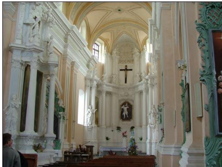
Šv. Mykolo Arkangelo bažnyčios interjeras

Bažnyčia - trinavis bazilikinis sakralinis pastatas su pusapvale apside. Išliko vertingas vėlyvojo baroko bažnyčios pagrindinis altorius ir Šv. Mykolo Arkangelo paveikslas, šoniniai altoriai, fundatoriaus K. Chodkevičiaus portretas. 1898 m. slapta nuo carinės valdžios bažnyčioje įrengta memorialinė lenta A. Mickevičiui. Dominikonų vienuolyno ir mokyklos pastatai neišliko.