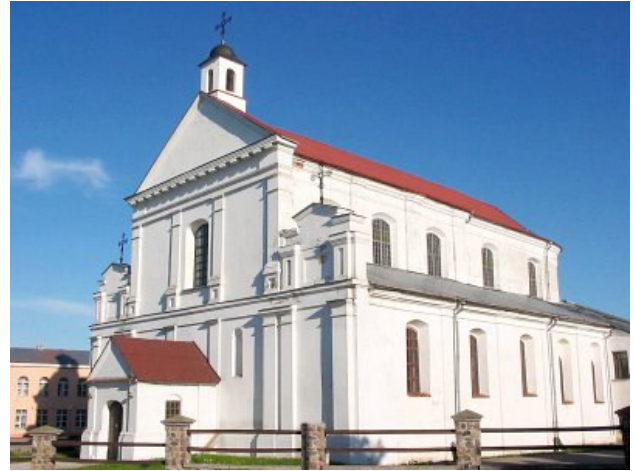
Dominikonų vienuolyno Šv. Mykolo Arkangelo bažnyčia XIX a. II pusėje (su varpine, neišlikusi) ir šiandien

Bažnyčia - trinavis bazilikinis sakralinis pastatas su pusapvale apside. Išliko vertingas vėlyvojo baroko bažnyčios pagrindinis altorius ir Šv. Mykolo Arkangelo paveikslas, šoniniai altoriai, fundatoriaus K. Chodkevičiaus portretas. 1898 m. slapta nuo carinės valdžios bažnyčioje įrengta memorialinė lenta A. Mickevičiui. Dominikonų vienuolyno ir mokyklos pastatai neišliko.