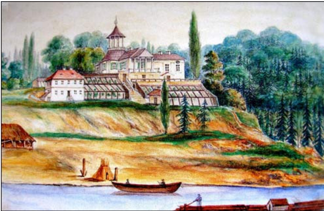
Panemunės dvaro sodyba XIX a. II pusėje. Napoleono Ordos piešinys, 1861-1869 m.