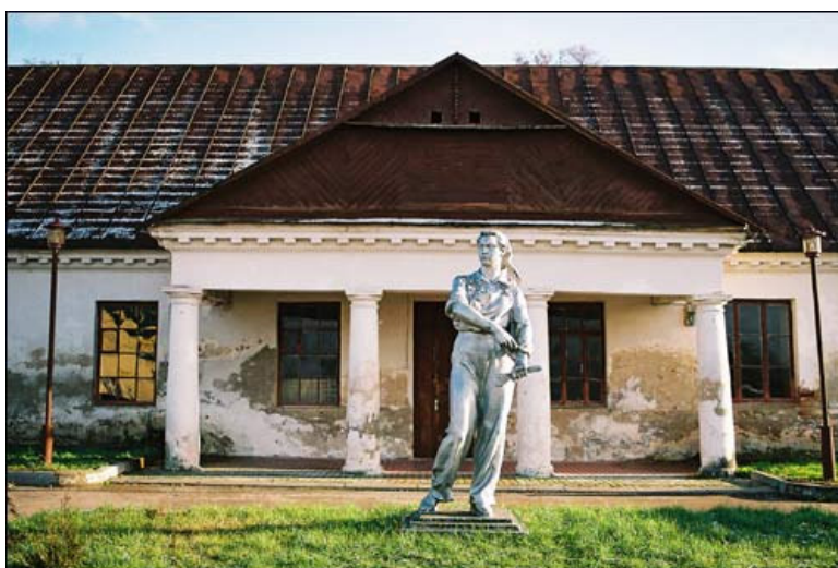
Išlikusios dvaro sodybos arklidės