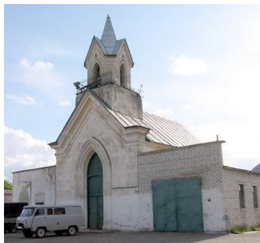
Neogotikinė koplyčia ( Глобус Беларусі )