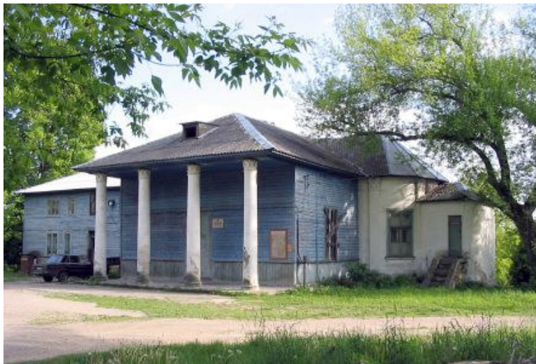
Rūmų fasado į kiemo pusę likučiai ( Глобус Беларусі )