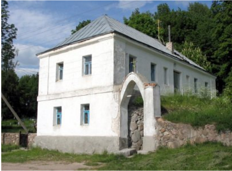
Klebonijos namas