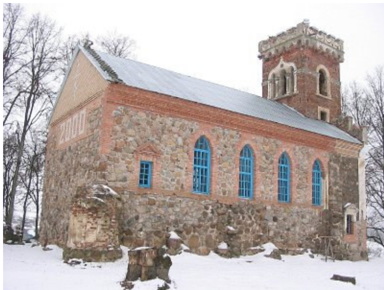
Raicos Viešpaties Atsimainymo cerkvė ( Глобус Беларусі )

Bažnyčia - neogotikos (angliškos gotikos) sakralinės architektūros paminklas, stačiakampio plano su masyviu kvadratinio plano bokštu fasade. Bažnyčią XIX a. II p. pertvarkant į cerkvę jos išorės architektūra nepakeista; dabartinė interjero įranga, medinis perdengimas XX-XXI a. sandūros. Greta bažnyčios, pakalnėje išlikęs XIX a. klebonijos namas. Kaip cerkvė ir klebonija atrodė XIX a. II p., galime pamatyti Napoleono Ordos akvarelėje.