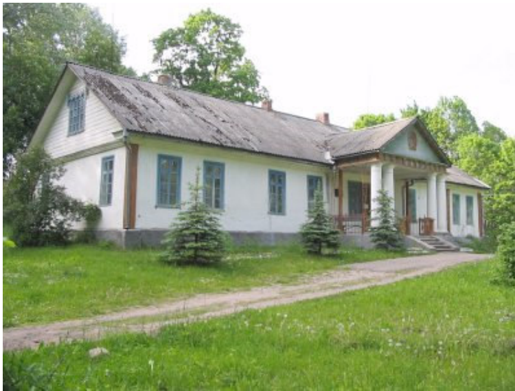
Raicos dvaro gyvenamasis namas