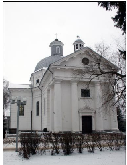
Pijorų kolegijos pastatas ir Šv. Teresės bažnyčia