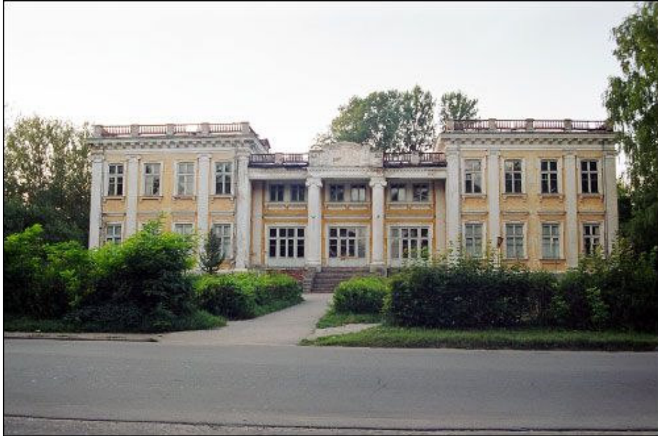
Scipijonų dvaro rezidencija

Scipijonų dvaro sodyba (XVIII a. II pusė). XVIII a. pabaigoje Ščiutine buvo pastatyta įspūdinga barokinė-klasicistinė Scipijonų giminės rezidencija. Tai pereinamojo iš baroko į klasicizmą stiliaus architektūros paminklas, pastatytas pagal architekto K. Piolo projektą.