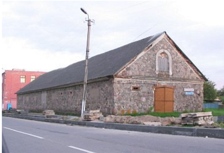
XIX a. dvaro sodybos ūkinis pastatas