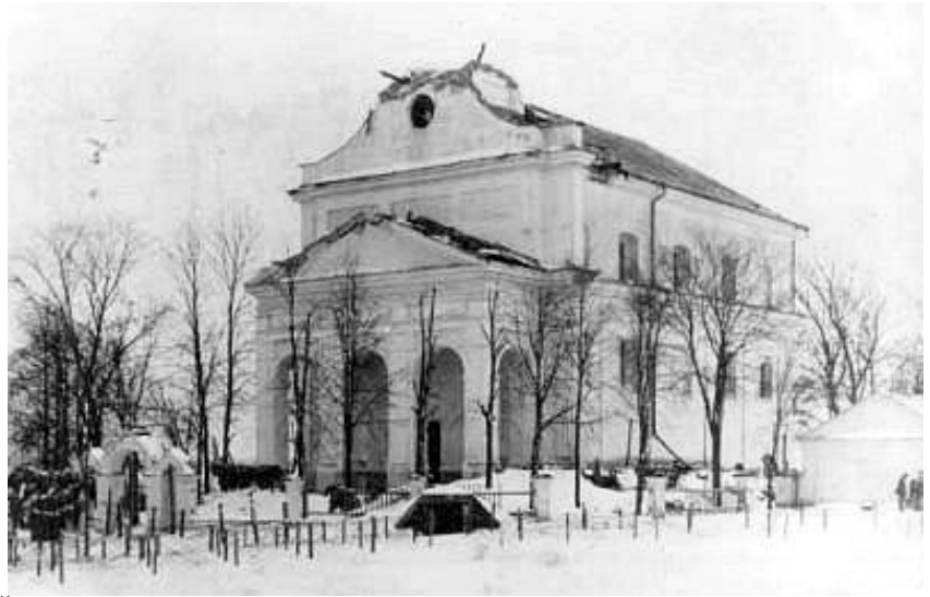
Ščorsų Šv. Dimitrijaus iš Salonikų cerkvė I pasaulinio karo metu

Cerkvė XIX a. atiteko stačiatikiams, nukentėjo 1930 m. gaisro metu, nuo 1988 m. veikia kaip stačiatikių cerkvė.