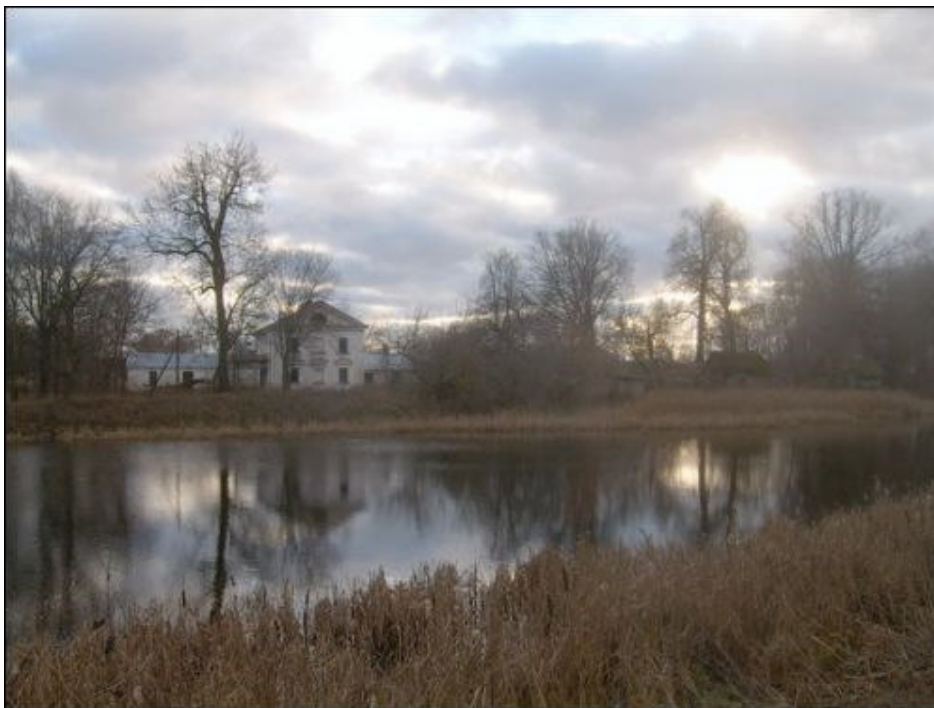
Chreptavičų dvaro sodybos parkas su tvenkiniais