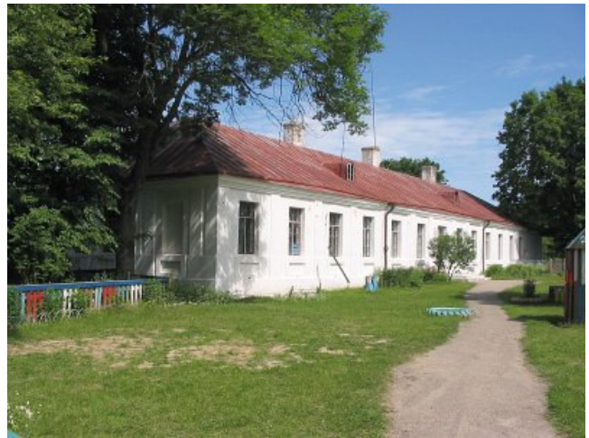
Išlikę Chreptavičių rūmų pamatų fragmentai ir vienas iš dviejų šoninių fligelių ( Глобус Беларусі )