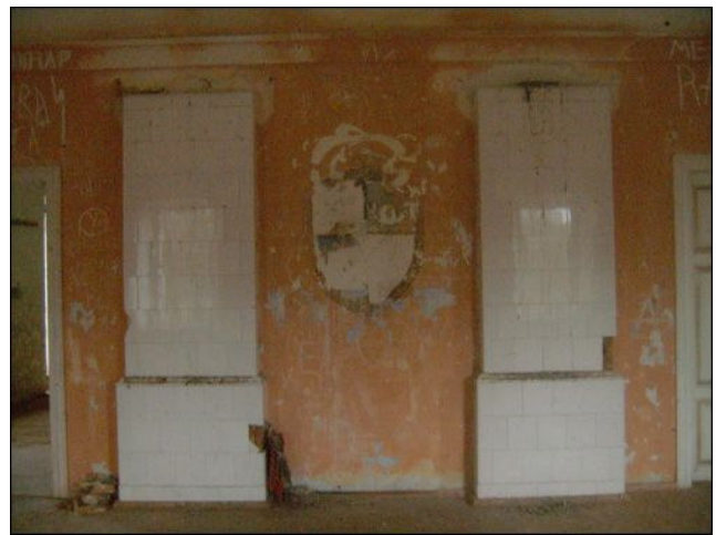
Išpūdingiausias iš išlikusių Chreptavičių dvaro sodybos pastatų - biblioteka