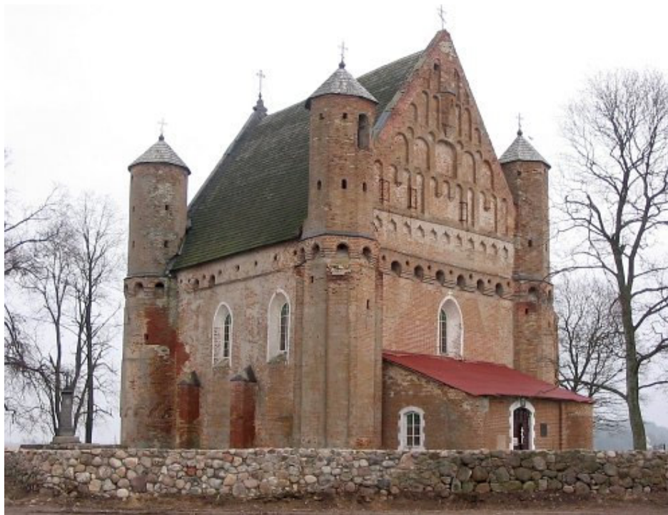
Sinkovičių Šv. Mykolo Arkangelo cerkvė (Глобус Беларусі)

Cerkvės šventorius XIX a. pabaigoje aptvertas lauko akmenų mūro tvora, greta pagrindinio fasado 1891 m. pastatyta lauko akmenų ir plytų mūro kvadratinio plano dviejų tarpinių varpinė. Cerkvės interjero įranga XX a. II pusės. Pasakojama, kad interjeras buvęs dekoruotas freskomis, tačiau XX a. II p. kažkoks „gudruolis“ sugebėjo visas sienas ir skliautus nudažyti aliejiniais dažais ir pražudyti visą tapybą.