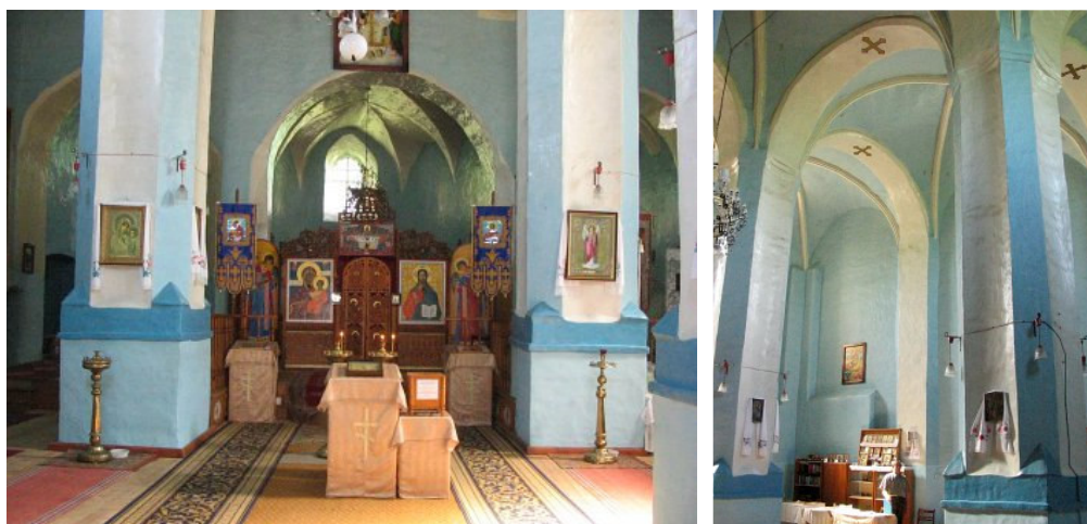
Sinkovičių Šv. Mykolo Arkangelo cerkvės interjeras (Глобус Беларусі)

Cerkvės šventorius XIX a. pabaigoje aptvertas lauko akmenų mūro tvora, greta pagrindinio fasado 1891 m. pastatyta lauko akmenų ir plytų mūro kvadratinio plano dviejų tarpinių varpinė. Cerkvės interjero įranga XX a. II pusės. Pasakojama, kad interjeras buvęs dekoruotas freskomis, tačiau XX a. II p. kažkoks „gudruolis“ sugebėjo visas sienas ir skliautus nudažyti aliejiniais dažais ir pražudyti visą tapybą.