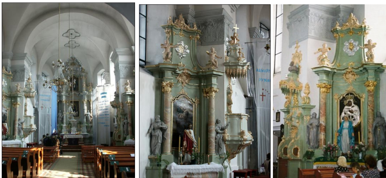
Slanimo Švč. Mergelės Marijos Nekalto Prasidėjimo bažnyčios interjeras, šoninis altorius su ambona, šoninis altorius su klausykla