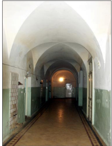
Slonimo bernardinių vienuolyno vienas iš korpusų