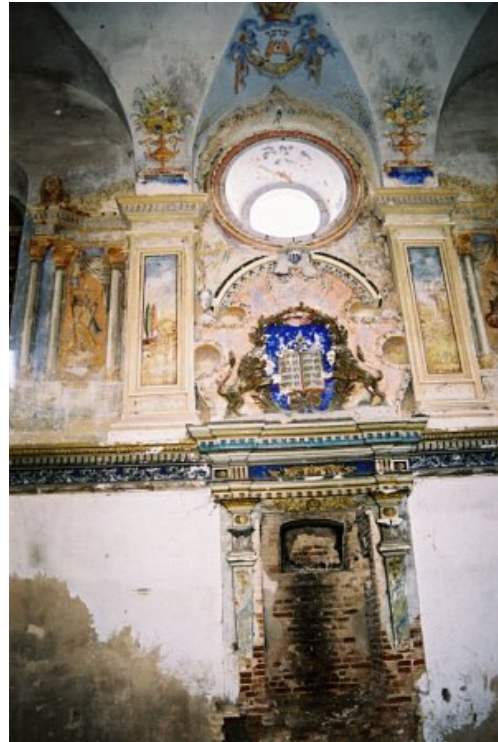
Siena su aronkodešo liekanomis ( Глобус Беларусі )

XIX a. Slanime buvo net 7 sinagogos ir 14 maldos namų. Didžioji sinagoga uždaryta II Pasaulinio karo metais (1940), sovietmečiu buvo naudojama kaip sandėlis (sinagoga stovi visai šalia miesto turgaus), 2001 m. grąžinta BR judėjų susivienijimo nuosavybėn, turėtų prasidėti restauracijos darbai.