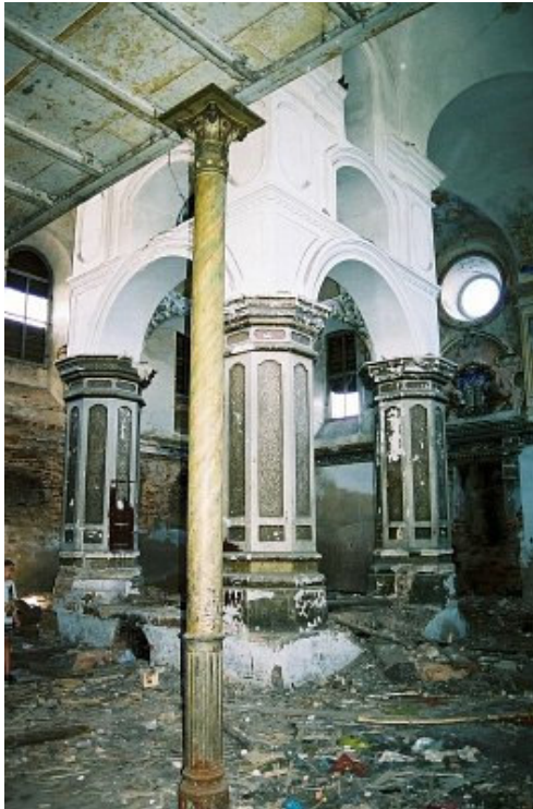
Choro galerijos fragmentas, toliau centre- bima

Interjere gerai išlikę barokinio interjero architektūriniai elementai – navos centre bima, prie sienos prišlietas aronkodešas ir nemažai sienų tapybos fragmentų, taip pat choro galerija su metalinėmis atramos-kolonomis (greičiausiai pastatyta XIX a. II p.).