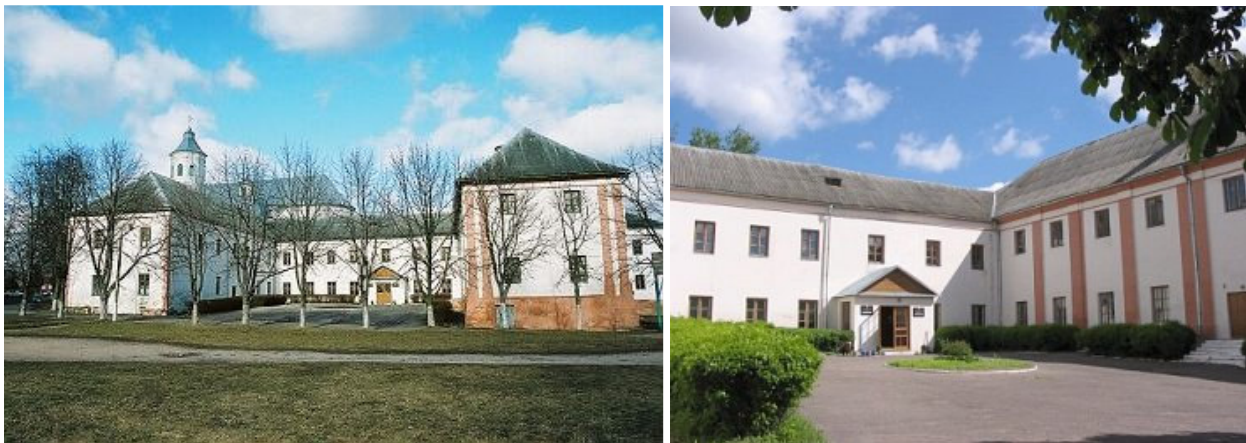
Slanimo bernardinų vienuolyno pastatai

XVIII a. vid. (1749) pastatytas U plano dviejų aukštų vienuolyno pastatas, besijungiantis koridoriumi iš pietų pusės su bažnyčia; 1864 m. vienuolynas uždarytas, jo pastatuose nuo 1870 m. veikė stačiatikių dvasinė seminarija, o bažnyčia pertvarkyta į cerkvę.