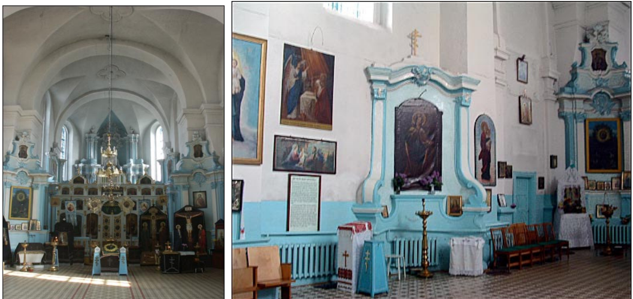
Slanimo Švč. Trejybės cerkvės interjeras

1668 m. iš šiaurinės pusės buvo pristatyta grafų Sliznių koplyčia, o prie pietinės sienos 1750 m. koplyčią pasistatė kunigaikščiai Palubinskiai. XVIII a. vid. bažnyčia buvo atnaujinta vėlyvojo baroko stiliumi - įrengti penki stiuko altoriai, vargonų chorai, šiaurinės ir pietinės koplyčių portalai, ambona.