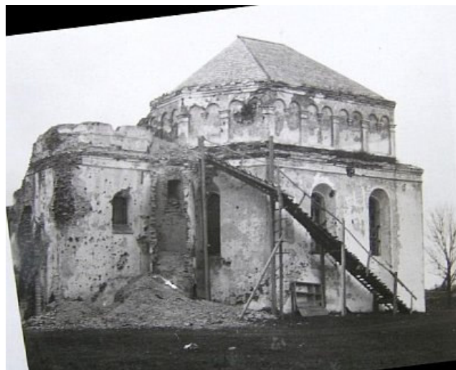
Smurgainių bažnyčia XIX a. (Jankowski. Powiat oszmiański, cz.2 , 1897) ir po I pasaulinio karo (1919 m. nuotr.)