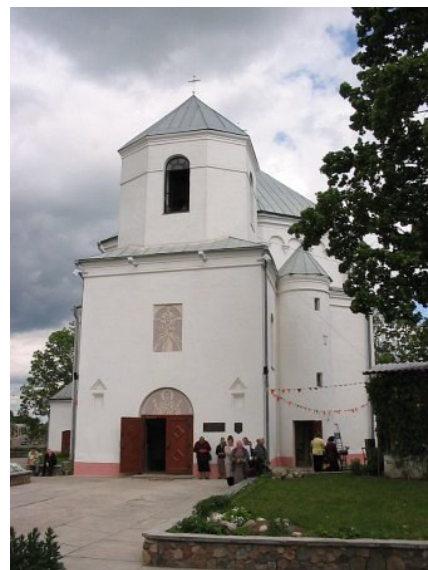
Smurgainių Šv. Mykolo Arkangelo bažnyčia (Глобус Беларусі)

Kupolinis centrinio plano pastatas (aštuoniabriaunio plano) su kvadratinio plano bokštu pagrindiniame fasade (išlikę tik du tarpsniai) - originalus renesanso architektūros paminklas. Po bažnyčia įrengtos laidojimo kriptos.