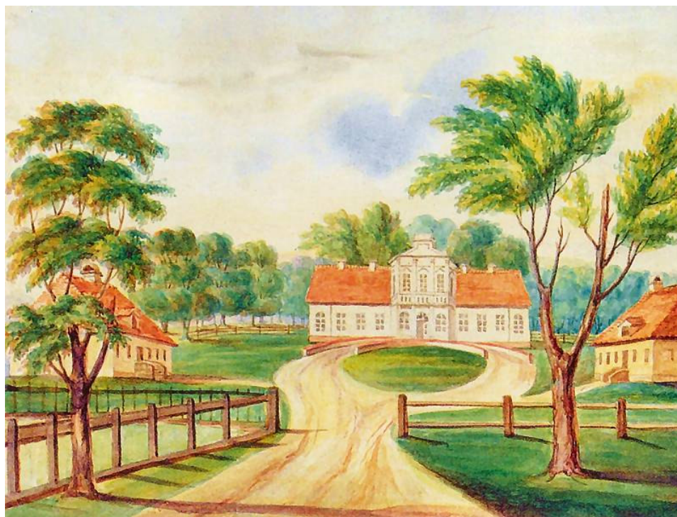
Stanislovavo dvaro sodyba XIX a. II pusėje (Napoleono Ordos piešinys)

Šiaurės rytinėje Gardino miesto dalyje Stanislovavo priemiestyje XVIII a. 7-8 dešimtmečiais buvo pastatyta karališkoji Stanislovo Augusto Poniatovskio užmiesčio rezidencija . Dvaro sodyba dar vadinamas „Stanislovavo“ vardu. Rezidenciją karaliui pagal garsaus architekto Giuseppe de Sacco iš Veronos projektą pastatė LDK iždininkas, karališkųjų ekonomijų administratorius, administravęs ir Gardino ekonomiją, Antanas Tyzenhauzas.