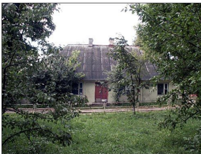
Dvaro sodybos dešinysis ir kairysis flygeliai