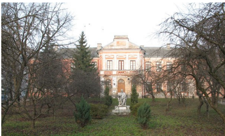
Stanislovavo rūmų pagrindinis fasadas

Dvaro sodyba pastatyta ankstyvojo klasicizmo su baroko bruožais stiliumi. Ansamblis reguliaraus plano. Pagrindinė ansamblio dominantė - rūmai ir jos atžvilgiu simetriškai išdėstyti šoniniai fligeliai formuoja paradinį kiemą. Už rūmų įveistas reguliaraus planavimo parkas (apie 3 ha ploto, dalinai išlikęs), ūkiniai pastatai išdėstyti už vakarinio fligelio. Dabar rūmų pastatas dviaukštis (pradžioje dviaukštė buvo tik centrinė rūmų dalis, o šoniniai flygeliai vieno aukšto). Pagrindinio fasado centre dominuoja rizalitas su portiku