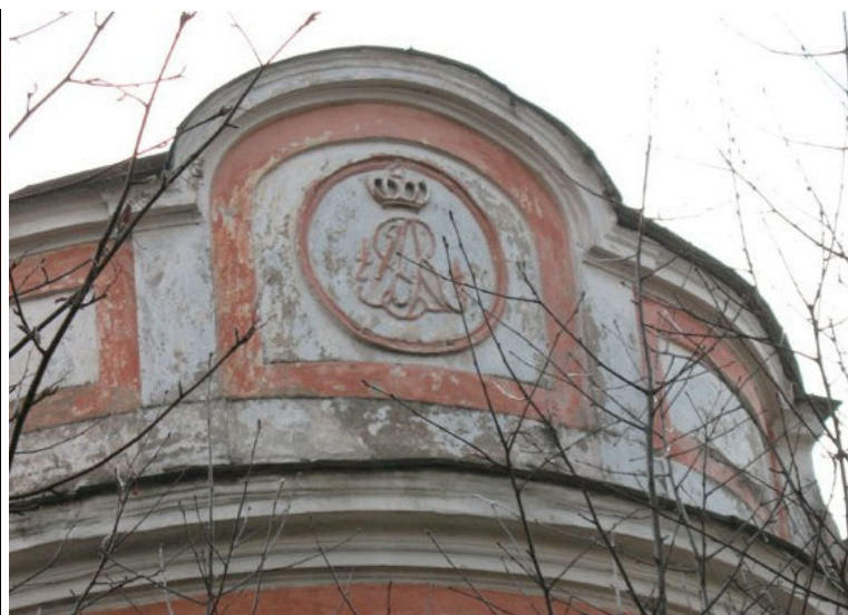
Rūmų fasadas į parko pusę ir medalionas su karaliaus monograma