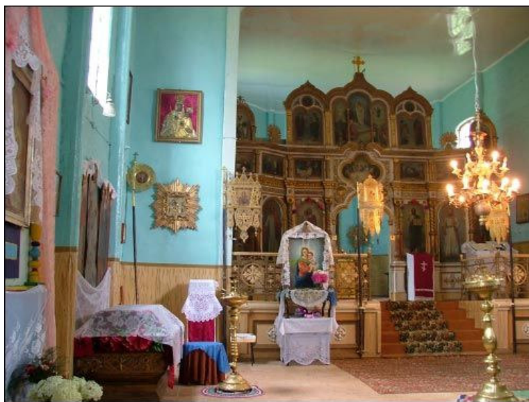
Valevkos Šv. Petro ir Povilo cerkvės interjeras

Bažnyčia - liaudies sakralinės architektūros su baroko elementais paminklas. Pastatas kvadratinio plano su pusapvale apside. 1840 m. nuardyti fasade buvę du bokštai (išlikę tik apatiniai jų tarpsniai), XX a. 4 deš. priešais fasadą pastatyta kvadratinio plano trijų tarpinių varpinė-prieangis.