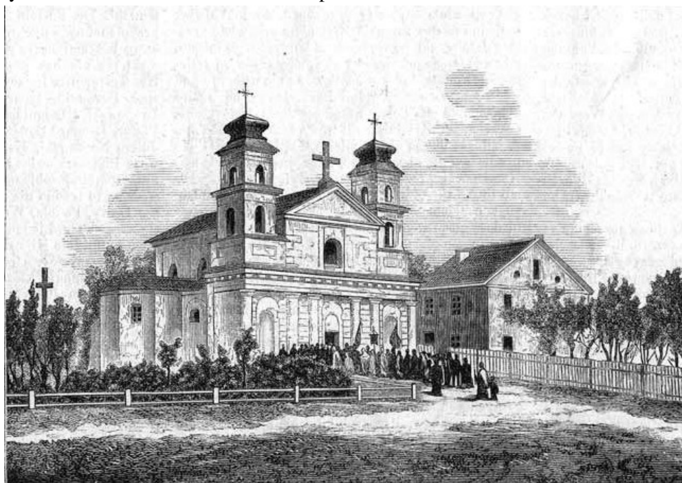
Varančios Šv. Onos bažnyčia XIX a. II pusėje ( Kłosy, 1878, nr 701 )

Bažnyčia - trinavė bazilika su kvadratine apside ir dviem aukštais bokštais fasade.