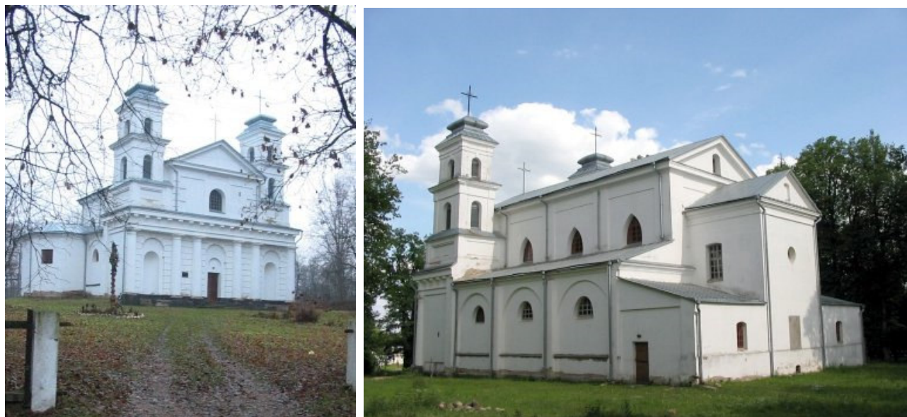
Varančios Šv. Onos bažnyčia (Глобус Беларусі)

Bažnyčia sovietmečiu uždaryta, stipriai sunykusi. XX a. paskutiniame dešimtmetyje atstatyta ir gražinta tikintiesiems.