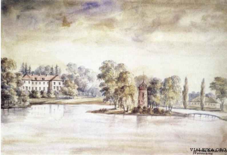
Abramovičių rūmai ir parkas. Napoleonas Orda, XIX a. II pusė

XVIII a. vid. – II p. miestelio savininkų Abramovičių iniciatyva buvo perstatyta visa centrinė Varnionių dalis – sukurtas vėlyvojo baroko urbanistinis ansamblis. Prie pagrindinės ištęsto stačiakampio plano aikštės rytinės kraštinės pastatyta miestelio ansamblio dominantė Šv. Jurgio bažnyčia, jai iš šonų pastatyti kampu į bažnyčią pasukti du dviaukščiai barokiniai pastatai - vaistininko namas ir klebonija (1770, išlikę). Vakariniame aikštės krašte priešais bažnyčią buvo išsidėstęs miestelio savininkų Abramovičių rūmų ir parko ansamblis (išlikęs tik parkas, XIX a. pr. paviljonas-bokštas, malūnas, ledainė; dviaukščiai rūmai sunaikinti I Pasaulinio karo metu). Šiaurinis ir pietinis aikštės šonai buvo užstatyti tipiniais (pagal vieną projektą) gyvenamaisiais namais, karčema ir prekybos eilėmis. Keletas gyvenamųjų namų ir karčemos pastatas yra išlikę.