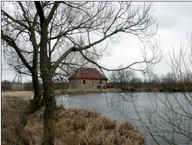
Parkas ir išlikęs malūnas (XIX a.)