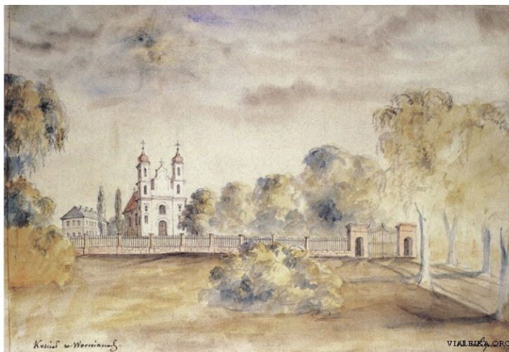
Šv. Jurgio bažnyčia. Napoleonas Orda, XIX a. II pusė

Bažnyčia - vėlyvojo baroko vienanavis sakralinis pastatas su kvadratinio plano apside ir dviem aukštais, grakščiais trijų tarpsnių bokštais pagrindiniame fasade. Prieangis pagrindiniame fasade pristatytas XIX amžiuje. Bažnyčia priskirtina Vilniaus baroko architektūros mokyklai. Jos altorius kadaise puošė Simono Čechavičiaus ir jo mokinių paveikslai.