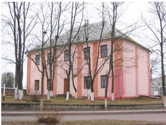
Vaistininko namas, XVIII a. pab. (Глобус Беларусі)

Bažnyčia - vėlyvojo baroko vienanavis sakralinis pastatas su kvadratinio plano apside ir dviem aukštais, grakščiais trijų tarpsnių bokštais pagrindiniame fasade. Prieangis pagrindiniame fasade pristatytas XIX amžiuje. Bažnyčia priskirtina Vilniaus baroko architektūros mokyklai. Jos altorius kadaise puošė Simono Čechavičiaus ir jo mokinių paveikslai.