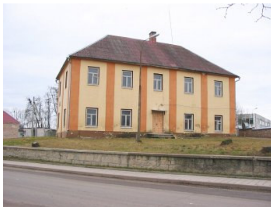
Klebonija, XVIII a. pab. (Глобус Беларусі)