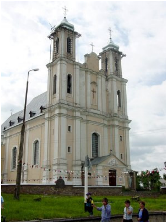
Šv. Jurgio bažnyčia