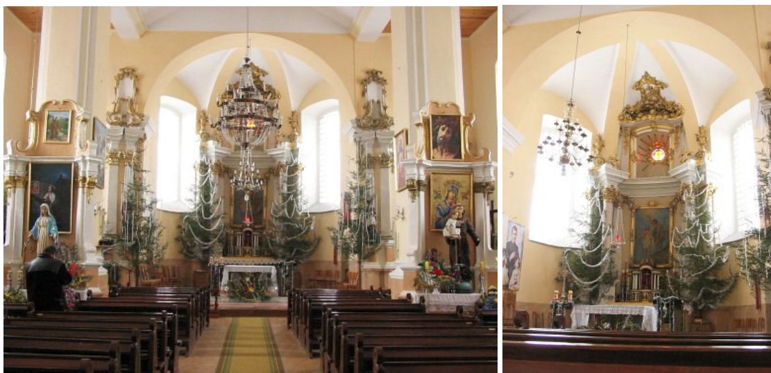
Vosyliškių dominikonų vienuolyno Šv. Jono Krikštytojo bažnyčios interjeras

Bažnyčia - vėlyvojo baroko sakralinės architektūros paminklas, trinavis stačiakampio plano su pusapvale apside ir dviem bokštais fasade sakralinis pastatas. Bažnyčia priskirtina Vilniaus baroko architektūros mokyklai. Pertvarkant bažnyčią į cerkvę buvo dalinai perstatytas jos fasadas – nuardyti bokštų viršutiniai (ketvirti) tarpniai ir perstatytas vėlyvojo baroko frontonas tarp jų. Bažnyčia yra netekusi skliautų, dabar perdengimas medinis. Interjere išlikęs vertingas Vilniaus baroko architektūros mokyklai būdingas septynių altorių ansamblis – pagrindinis, du šoniniai ir keturi prie piliorių.