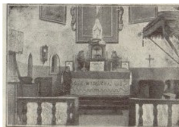
Šv. Kazimiero bažnyčia XX a. pr. ( Nasze kościoły t.2, z.20, 1914 )

Už bažnyčios išlikusios senosios Vseliubo kapinės, paskutiniųjų Vseliubo savininkų grafų O'Rourk giminės palaidojimo klasicistinė koplyčia (1837?). Taip pat išlikęs XVIII a. įveistas grafų O'Rourk dvaro parkas, sukomponuotas ant besileidžiančių link dirbtinio ežero terasų (11 ha, susidedantis iš prancūziškojo ir peizažinio).