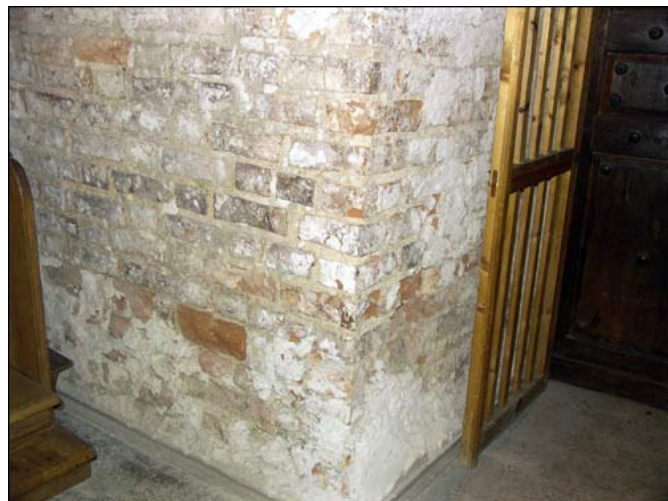
Šv. Kazimiero bažnyčios interjeras (Глобус Беларусі, Radzima.org)