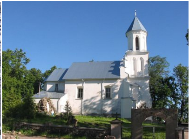
Šv. Kazimiero bažnyčios eksterjeras (Глобус Беларусі)

Išdegė pastato vidus, įgriuvo skliautai, išliko stovėti tik senosios storos gotikinės sienos. 1988 m. bažnyčia grąžinta tikintiesiems, atstatyta. Visas bažnyčios interjero dekoras, altoriai įrengti XX a. pabaigoje.