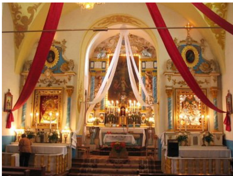
Žadiškių Švč. Trejybės bažnyčios interjeras