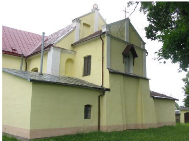
Žadiškių Švč. Trejybės bažnyčia