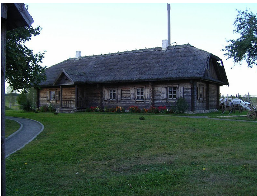
Atkurtas Mickevičių dvarelis