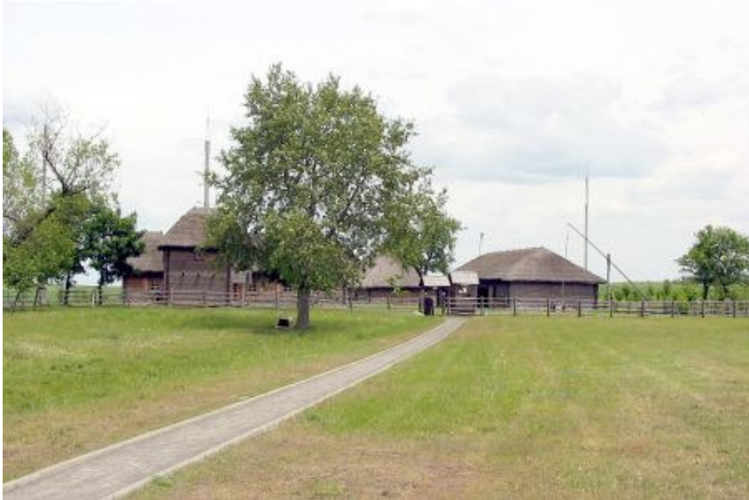
Atkurta dvarelio sodyba

1993-1998 m. dvarelio ansamblis pilnai atkurtas taip, kaip atrodė poeto gimimo ir vaikystės metais. Dabar čia veikia muziejus.